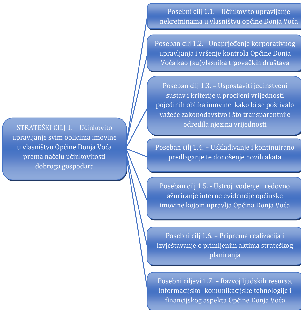
Slika 2. Kaskadiranje strateškog cilja upravljanja općinskom imovinom