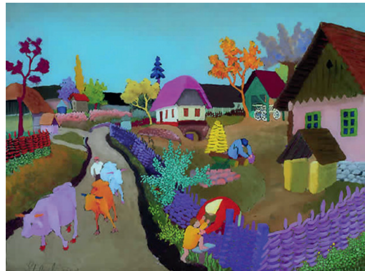
Uređuje se Galerija Slavka Stolnika

Podizanje komunalnog standarda općine ove godine započnemo izgradnjom, rekonstrukcijom i modernizacijom prometne infrastrukture. Što se tiče izgradnje vodovodne mreže za preostali dio općine, Rijeka Voćanska je upravo u gradnji, a Slivarsko, Donja Voća i Gornja Voća su u