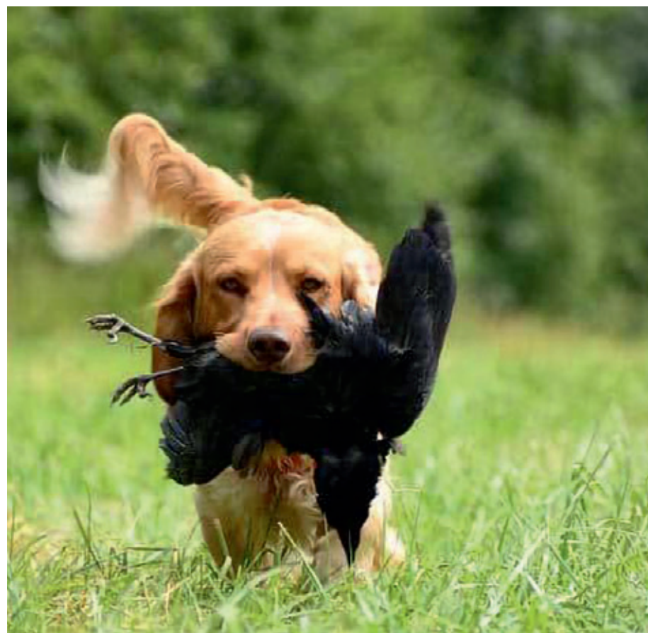
Lovni turizam iznimno je profitabilan

Uređenjem Galerije Slavka Stolnika stvorit ćemo novu turističko-kulturnu ponudu općine,